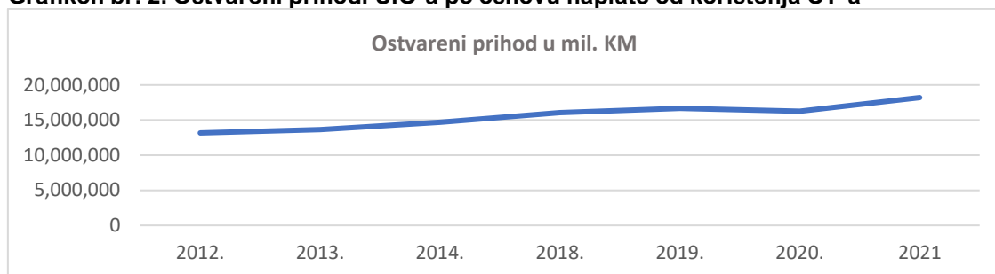
Grafikon br. 2. Ostvareni prihodi UIO-a po osnovu naplate od korištenja CT-a

Ured za reviziju na osnovu podataka UIO-a